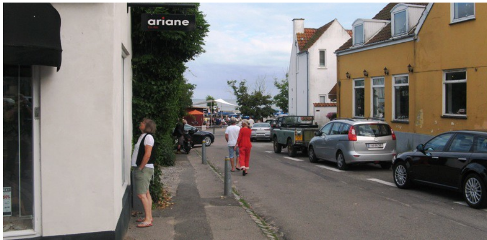
Den korte vej mellem Strandvejen og havnen skal også belægges med fliser, så den er en naturligt del af det nye havnetorv.

Og indvendinger mod at f.eks. nedsættelse af farten til 45, 40 eller 30 km/t ikke kan lade sig gøre på en vej af Strandvejens karakter kan afvises, idet det netop er sket længere inde ad Strandvejen mod København lidt nord for Klampenborg.