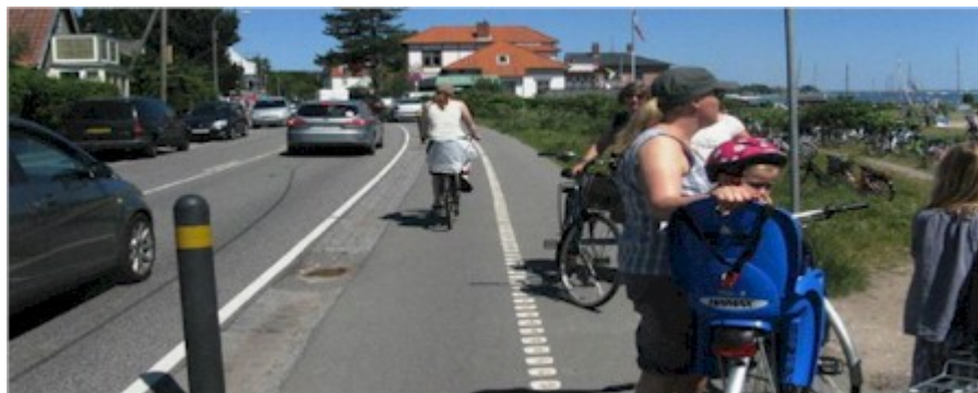
Cyklister og gående kæmper om samme areal. Hvorfor ikke udvide arealet med en promenade.