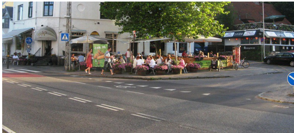
Torvet foran Divino ligger helt ud til den asfalterede vej med tæt trafik. Her et sjældent øjeblik uden biler.