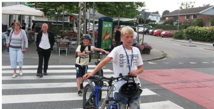
Der opstår ofte farlige situationer, når de svage trafikanter skal over Krydset, for at komme til og fra havnen og stranden.

En start kunne være at opstille nogle midlertidige pullerter, der indskrænkede vejbredderne og så se, hvordan trafikken reagerer. Antagelig skal man prøve forskellige modeller og siden analysere dem, inden man opnår den bedst mulige situation for de forskellige trafikanter sammenholdt med æstetikken. Sideløbende kan man lægge nye fliser og andre forbedringer på den nuværende plads foran Divino og pizzeriaet og på vejstykket ned mod havnen.