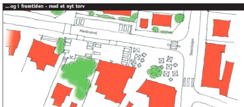
Principskitse visende p-plads og torveareal efter ombygning