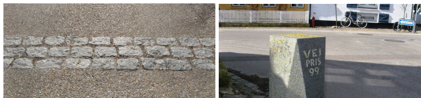
Trafikdæmpning kan udføres på mange måder. I Sletten har de lagt granitsten(rumler) i asfalten. For dette modtog Sletten i 1999 Vejprisen for smuk trafikdæmpning. Skal Espergærde havnetorv have en lignende pris.

Parkering i området er allerede i dag et stort problem, hvorfor en del vælger at parkere på det store p-område på Teknisk Forvaltning på Mørdrupvej 15. Da kommunen overvejer at sælge Teknisk Forvaltning vil der opstå store parkeringsproblemer, såfremt kommunen ikke på forhånd afsætter areal til offentlig parkering. Byforeningen skal derfor allerede anbefale at kommunen udviser "rettidigt omhu" og etablerer en offentlig p-plads før man sælger Teknisk Forvaltnings grund og bygninger.