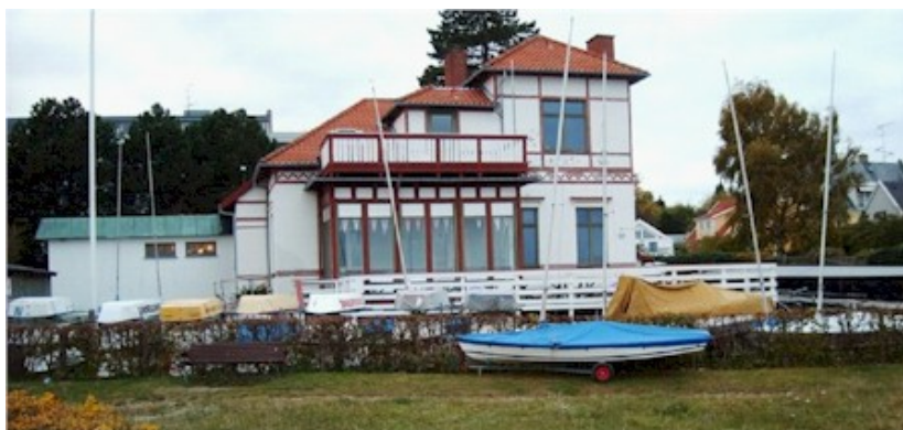
Nuværende klubhus set fra stranden. Huset burde være et fælleshus for alle havnens brugere og hækken burde fjernes, så hus, terrasser og udearealet var integreret med det offentlige strandareal.

Kommunen ejer bygningen og sejlkлубben lejer hovedparten af arealet inklusive udearealet, hvor de har oplag af små både ligesom de har opført en stor hævet træbalkon for ophold. En del af stueetagen udlejes til en mindre skobutik og mod nord er indrettet offentlige toiletter i stueetagen.