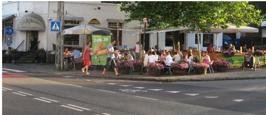
På pladsen foran Divino er der trængsel og stemning så snart vejret tillader det

Espergærde Byforening vil her i 2011 skabe fornyet politisk interesse for projektet, så de gode intentioner kan resultere i en begyndende planlægning og til afsættelse af de første økonomiske midler.