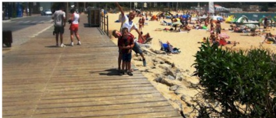
Promenade udført af træplanker mellem cykelstien og stranden.

Billedet ovenover er en strandpromenade, hvor de gående ikke risikerer konflikt med cyklister og omvendt. Promenaden er udført af kraftigt tømmer og trukket et par meter ud på strandarealet. En løsning, blandt mange, der nemt kunne udføres langs Espergærde strand og langs stejlepladsen nord for havnen.