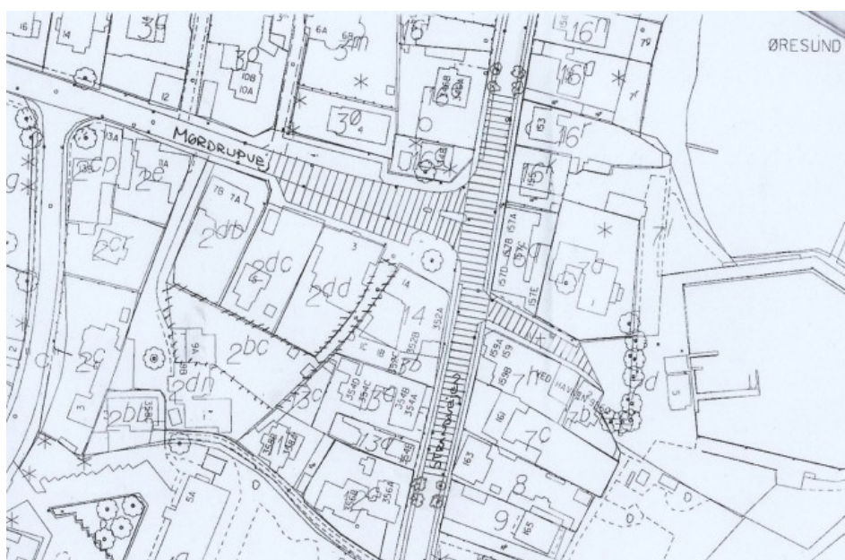
Skravering angiver vejareal, der foreslås belagt med fliser/granit og hvor der opstilles trafikregulerende pullerter, helle træer m.m. for at adskille biler fra de bløde trafikanter.

Mange bilister har oplevet at køre fra asfalt og køre ind på en flisebelægning, hvor lyden fra dækkene ændrer karakter og man visuelt opfatter, at nu kører man ikke længere på en vej, men på en plads eller en gågade. Selv den mest fartgale ungersvend kan ikke undgå at opfatte ændringen. Som trafikforsker Thaarslund sagde ved foreningens høring: Skilte alene hjælper ikke, gør torvet til en æstetisk dagligstue, det hjælper og forebygger. Ved overgangen fra asfaltvej til flisebelagte vej foreslås nye træer på begge vejsider, så disse virker som en grøn "byport" inden man kører ind på torvet. Udover en reduktion af farten vil en omlægning af vejkrydset og en ny torvebelægning alt andet lige medføre, at en del lastbiler og tung trafik vælger at køre ad motorvejen i stedet for Strandvejen, hvilket også vil reducere trafikken ad Mørdrupvej tværs gennem Espergærde og Mørdrup.